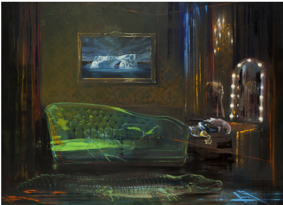
Sans titre, 2013 Huile sur toile, 210 x 260 cm