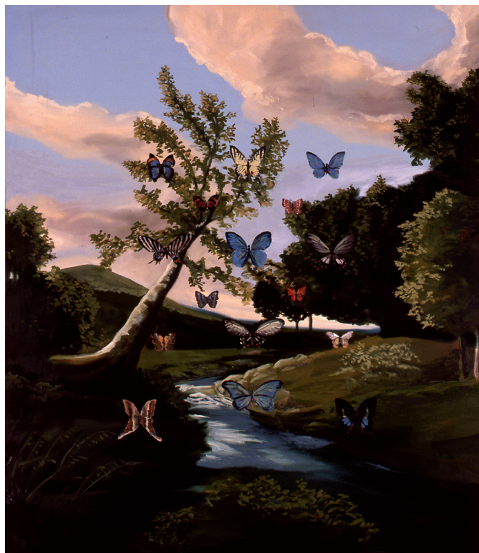
Sans titre , 2014 Huile sur toile, 200 x 180 cm Collection particulière

Extraits du texte de Daniel Schilde pour le catalogue de l'exposition