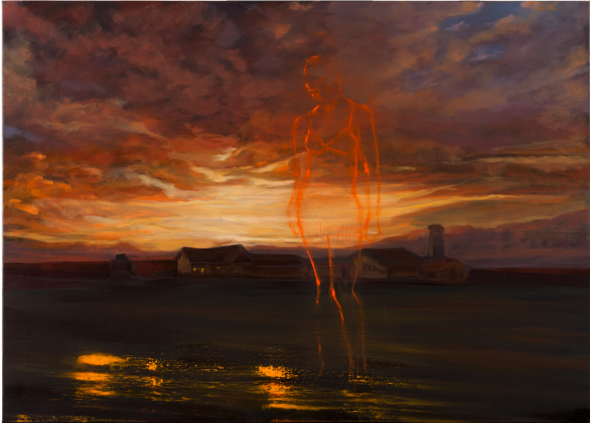
Sunset Diane , 2015 Huile sur toile, 73 x 92 cm

Demande de visuels haute définition assistant@lartenplus.com