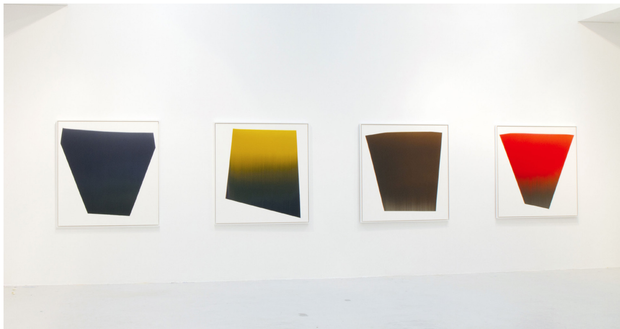
Vue de l'exposition « Et la peinture? » Galerie du jour agnès b., 2014, Paris

Travaux récents de l'artiste et œuvres emblématiques provenant de collections privées