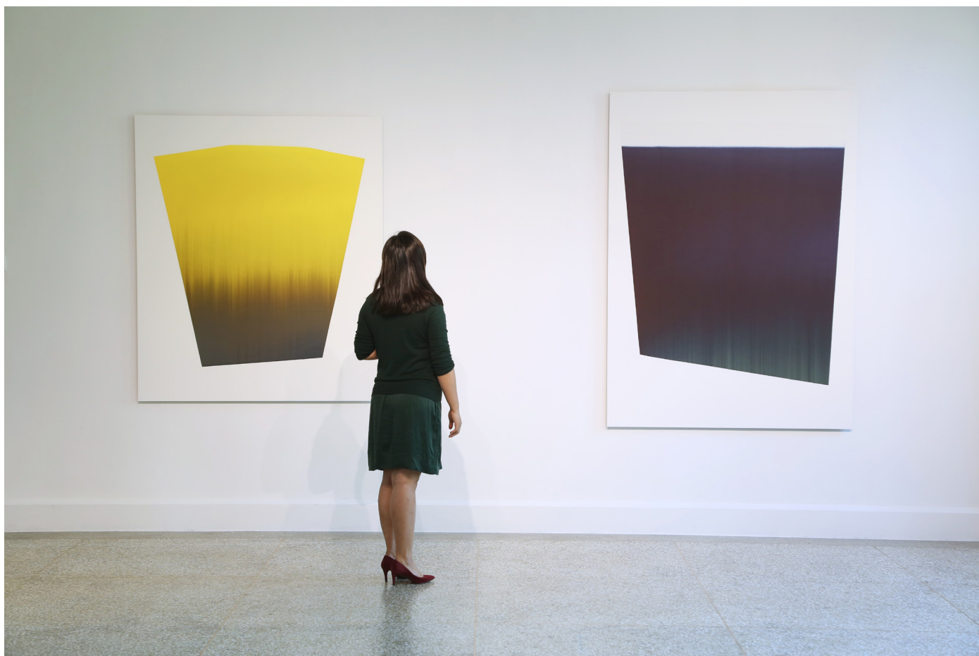
Vue de l'exposition « Résonance » Yishu 8 Maison des Arts, 2013, Pékin

[ ] ... Il me semble que Claire a ouvert une nouvelle porte dans le couloir de l'art abstrait (une image de cinéma). La délicatesse de l'encre qui abreuve le papier en partant de lignes droites, quant à moi me bouleverse. Agnès b.