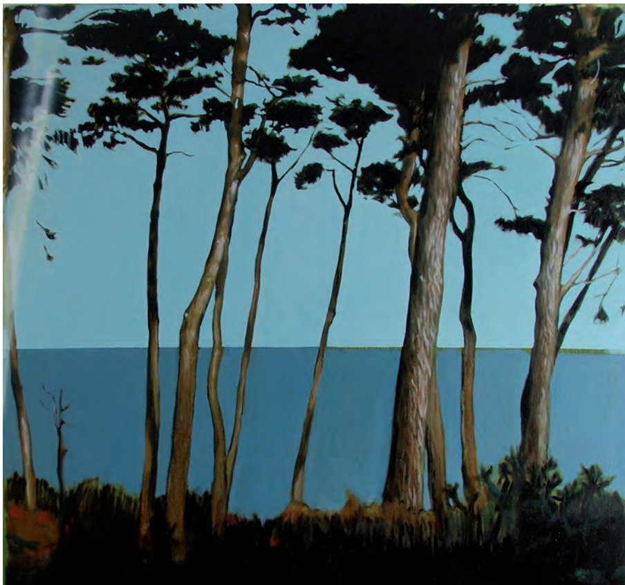
«Paysage 48»2007 collection privée

Extrait de Jérémy Liron, «l'être & le passage» , éditions La Termitière, 2012.