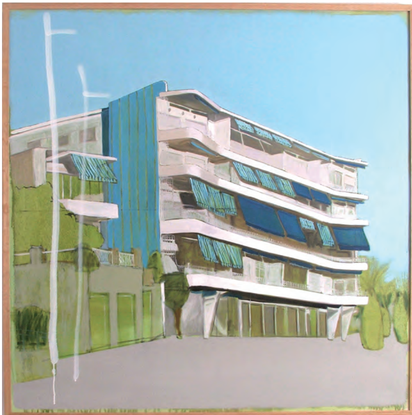
«Paysage 46» 2007 123x123 cm collection privée