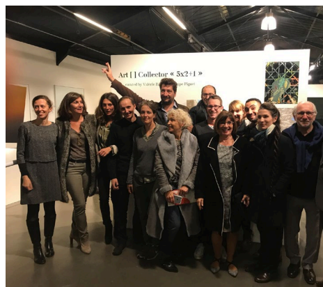
Art [ ] Collector 5 x 2 + 1, vernissage avec les artistes, à Bruxelles.